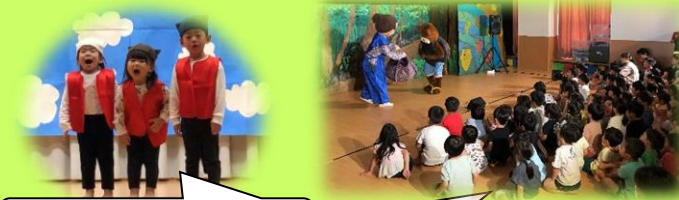
友達と一緒に表現遊び