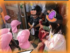
みんなで相談しながら 宝物探し