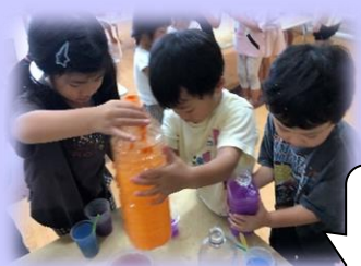
ここに色を入れると 何色ができるかな？