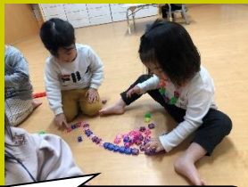
つながたビーズを 並べたり、数えたりする