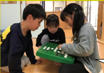
オセロの数を数える