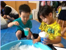
水の上に泡をのせたら どうなるだろう？