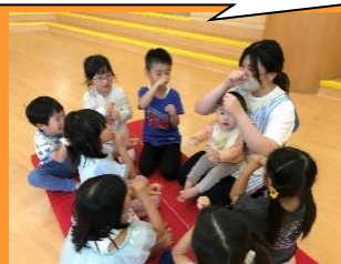
歌や手遊びをみんなで歌おう