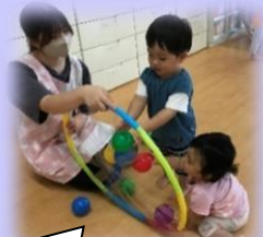
ボールがくっついたよ